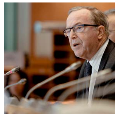
Wilfred Martens, ordförande i Gruppen progressiva förbundet av socialdemokrater (S & D)