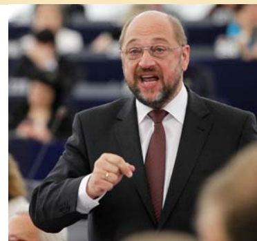
Martin Schultz, ordförande i Europeiska folkpartiet (EPP)

I september kom en uppmaning även från det näst största partiet i Europaparlamentet. Det var ordförande Martin Schulz i Gruppen progressiva förbundet av socialdemokrater (S & D) som uppmanade Turkiet att respektera Cyperns suveräna rättigheter och undvika hot och spänningar som kan ha en negativ inverkan på klimatet i Cypernsamtalen och grannrelationerna.